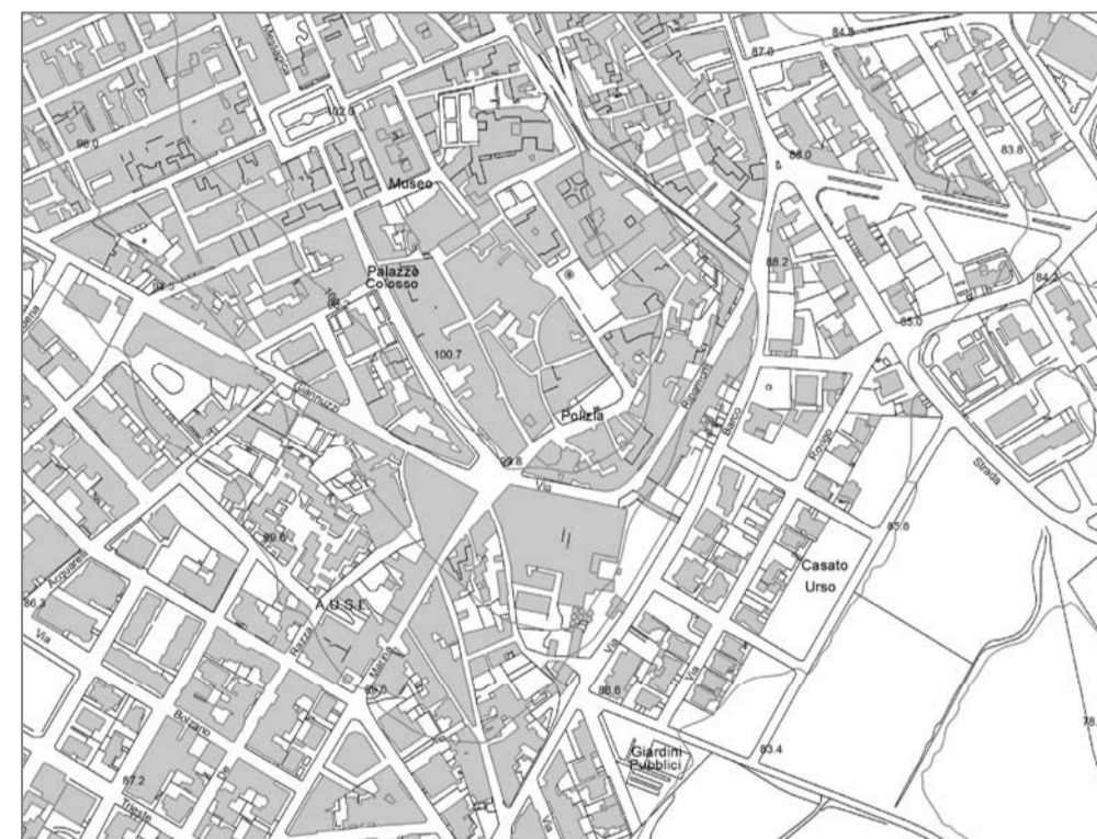
Carta Tecnica Regionale - Scala 1:4000