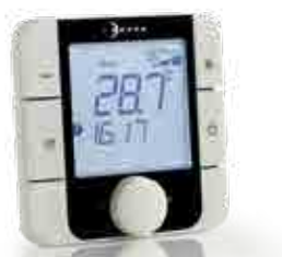
Terminale utente KTTZ/KTTUZ (per gestione centralizzata)

Legenda: ❖ Montato in fabbrica → Fornito separatamente