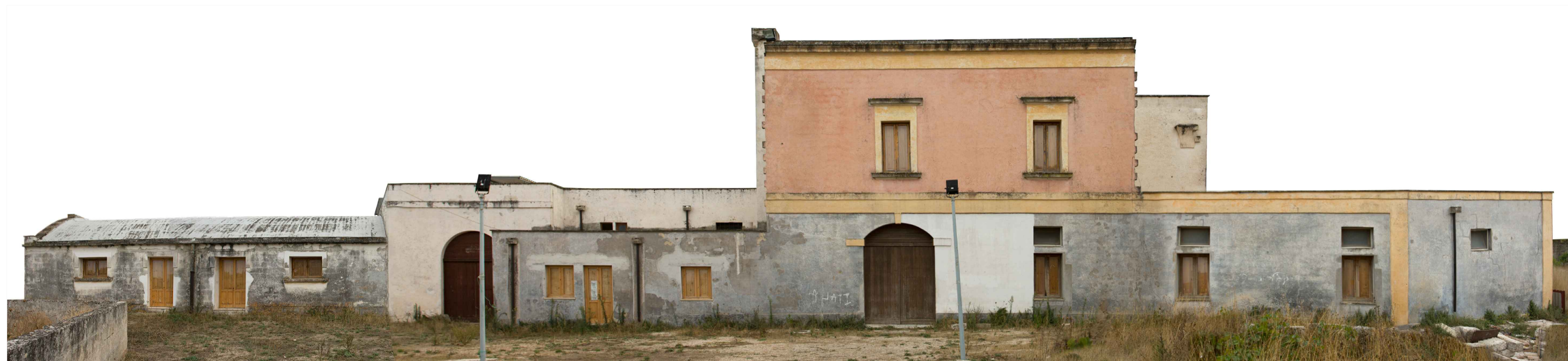
PROSPETTO NORD rilievo fotografico