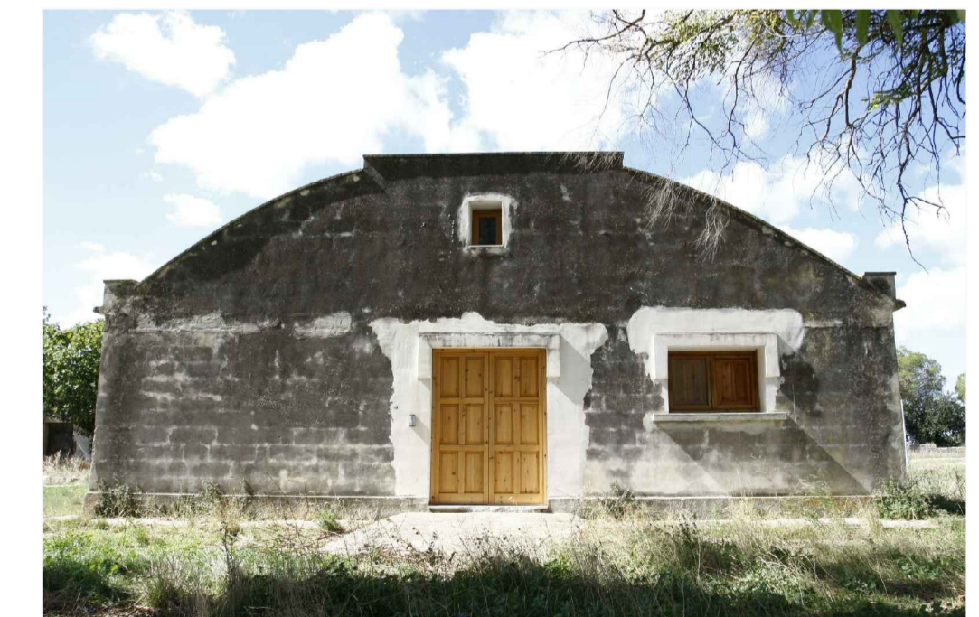
PROSPETTO EST rilievo fotografico