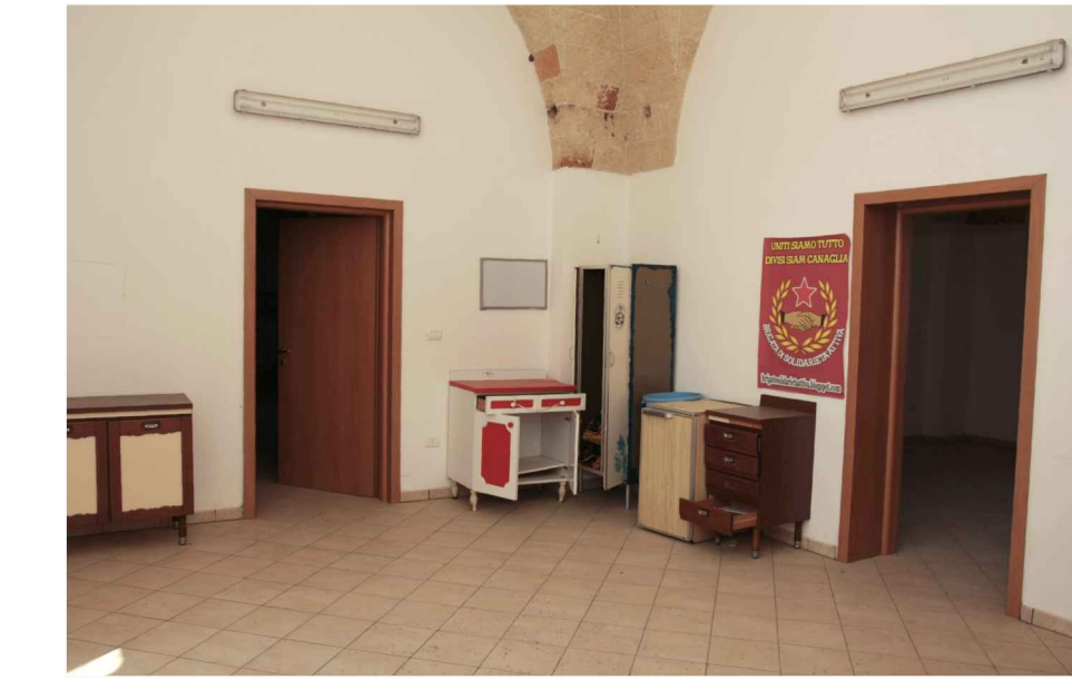
p.1 - vano 8