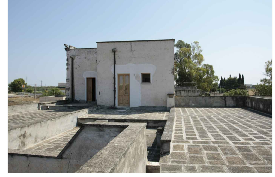
p.8 - terrazzo