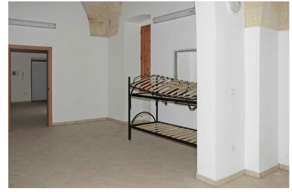
p.2 - vano 9