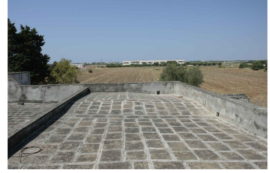
p.6 - terrazzo