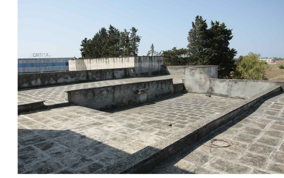
p.7 - terrazzo