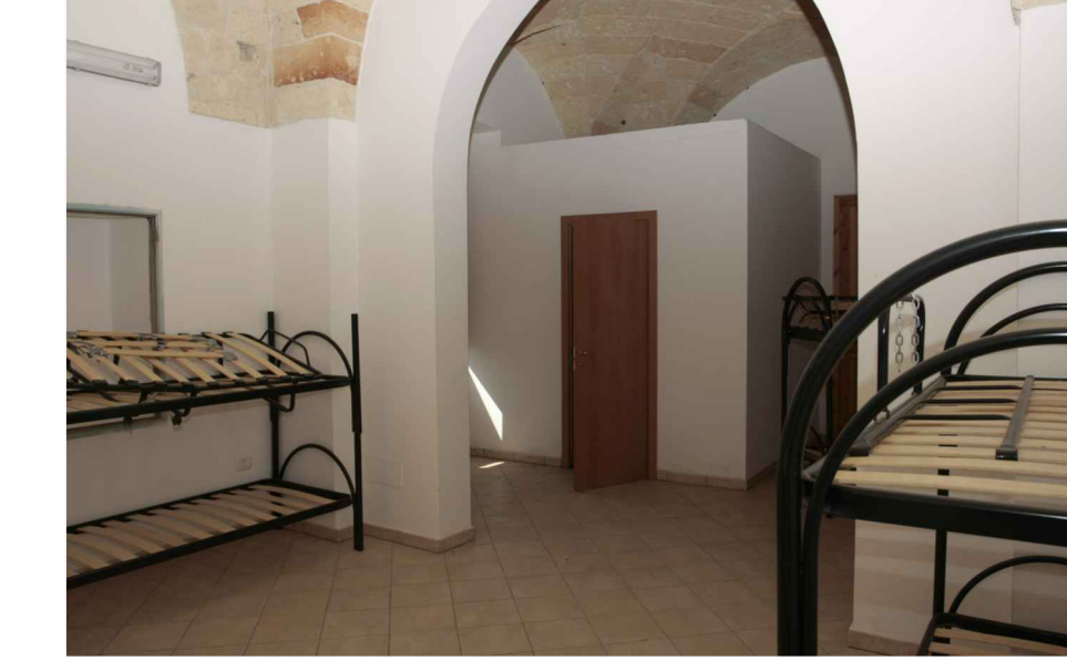
p.3 - vano 10